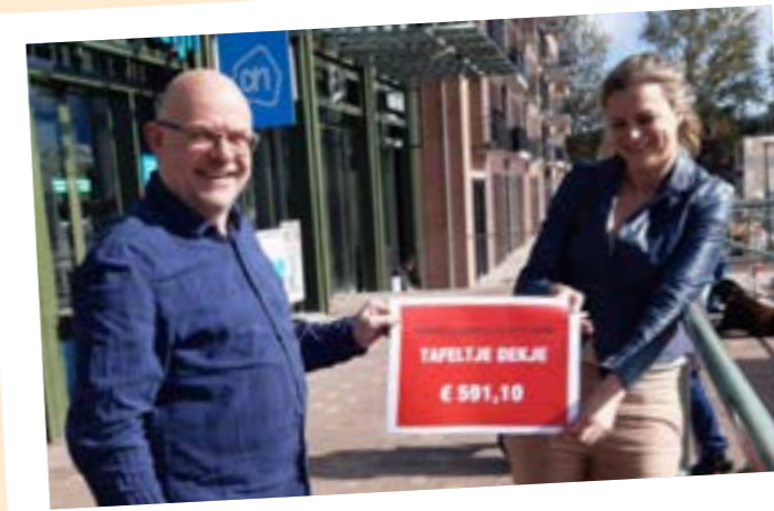
Emballage-actie Tafeltje dekje